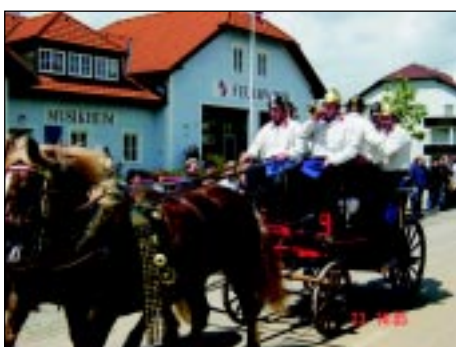
Pferdegespann der FF-Karlsbach