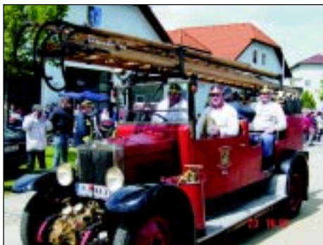
Kameraden der FF-Ried im Innkreis im Feuerwehroldtimer