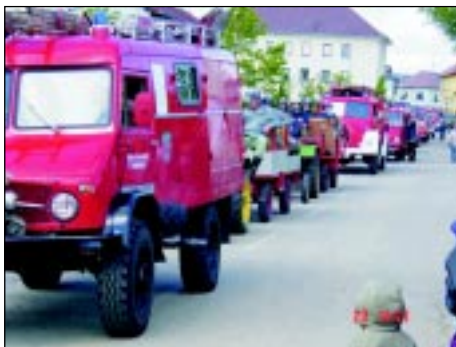
Blick auf den langen Zug der historischen FF-Fahrzeuge