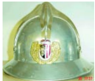
Fahne der FF Kollerschlag und Helm der Fahnenträger