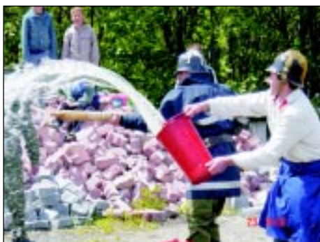
Historischer Löschangriff der FF Plöcking