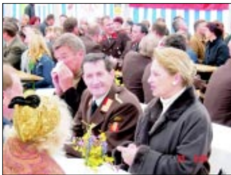
Ehrengäste des Festaktes „125 Jahre FF-Kollerschlag“