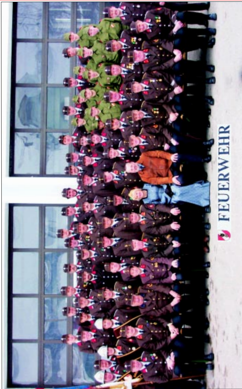
Mitglieder der FF-Kollerschlag 2004